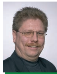
Alfred Halmetschlager Buchhaltung, Lohnverrechnung, EDV