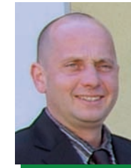
Karl Holzweber Wirtschaftshof